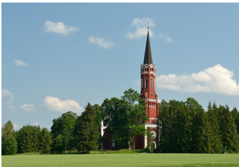
Joonis 1. Halliste kirik

Joonisteks nimetatakse kõiki teisi illustratiivse väärtusega materjale, nagu graafikud, diagrammid, skeemid, pildid, fotod, kaardid jne. Joonised on sarnaselt tabelitele nummerdatud ja varustatud seletusega ning neile viidatakse tekstis. Erinevus on selles, et joonise number ja seletus asub kohe joonise all, nagu on näha näidiseks toodud joonisel 1. Joonise number ja nimetus asub vasakule joondatult.